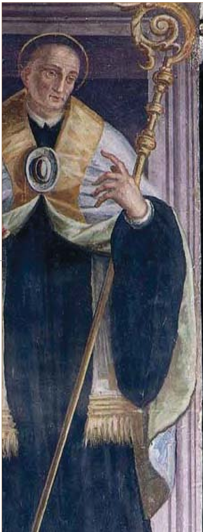
San Benedetto da Norcia Affresco nella Basilica di Farfa

re quotidianamente per costruire un futuro solido e duraturo della collettività circostante (che oggi diremmo “sostenibile”).